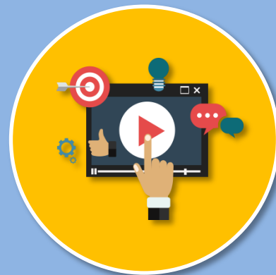
VDO นำเสนอโครงการ ความยาวไม่เกิน 5 นาที