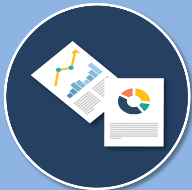
ข้อเสนอโครงการ แบบย่อ (Project Brief)