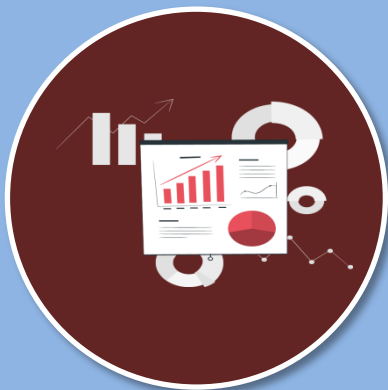
PowerPoint นำเสนอโครงการ