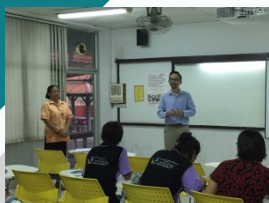
หลักสูตรเตรียมความพร้อมด้าน ภาษาอังกฤษเพื่อเตรียมสอบ TOEIC