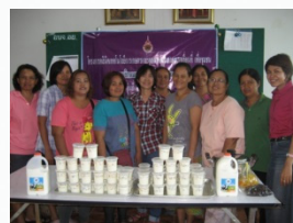
การทำเต้าหู้นมสด