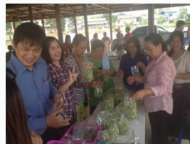
ต้นอ่อนทานตะวัน