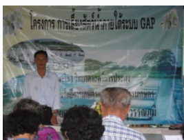
การเลี้ยงสัตว์น้ระบบ GAP