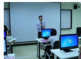
หลักสูตรการพัฒนาซอฟต์แวร์และ สื่อมัลติมีเดียเชิงพาณิชย์เพื่อชุมชน