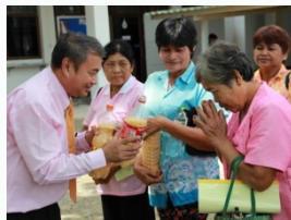
การปลูกข้าวโพดเทียน