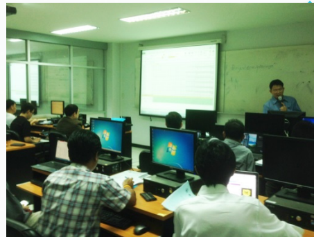
หลักสูตร IT Project Management