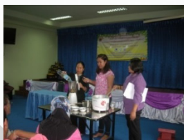
หลักสูตรการฝึกอบรมบุคลากร เพื่อเสริมสร้างศักยภาพต่อหน่วยงาน