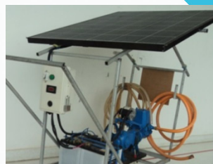
หลักสูตรการใช้โซล่าเซลล์ ในเกษตรกรรม