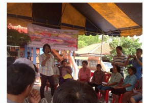
การผลิตน้ำหมักสมุนไพรควบคุมศัตรูพืช