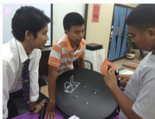
โครงการติดตั้งสัญญาณดาวเทียม