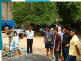
การผลิตก๊าซชีวภาพ