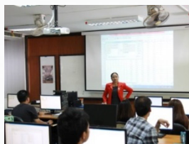
หลักสูตรเทคนิคการวิจัยการตลาด