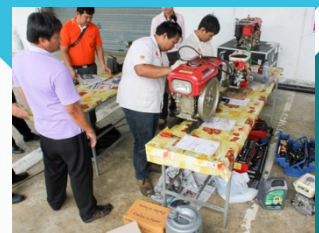
การฝึกอบรมซ่อมเครื่องยนต์เล็ก เพื่อการเกษตร