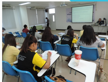
หลักสูตรการดูแลและบำรุงรักษาระบบสารสนเทศ