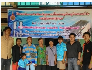
โครงการทำและซ่อมมุ้งลวด