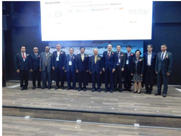
ภาพแสดง : ผู้บริหารและผู้เข้าร่วมงานในงานประชุมวิชาการ ISFT2018 และ 1 st RUSiCON