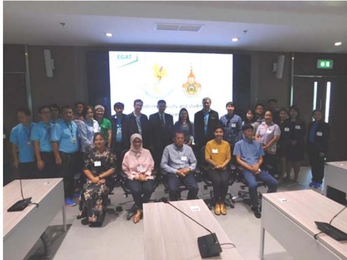
ภาพแสดง : การศึกษาดูงาน Innovative Electricity and Electrical Energy ณ การไฟฟ้าฝ่ายผลิตแห่งประเทศไทย

ภาพแสดง : พิธีมอบประกาศนียบัตรและรางวัล ให้กับผู้เข้าร่วมงานสัมมนาที่มีผลงานดีเด่น