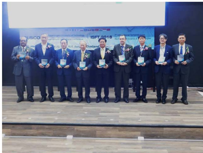
ภาพแสดง : คณะกรรมการดำเนินงานจากประเทศต่างๆ ในงานประชุมวิชาการ ISFT2018 และ 1 st RUSiCON